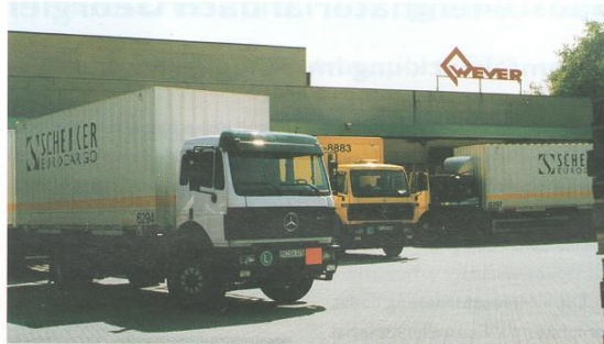
Bis zu 350 Sendungen übernimmt Schenker Eurocargo Schwelm arbeitstäglich ab dem Wever-Lager in Essen.

Sind Sie auch an einer umfassenden Beschaffungs- und/oder Distributionslogistiklösung für Ihre Produkte interessiert? Dann sprechen Sie mit Ihrer zuständigen Schenker Eurocargo-Geschäftsstelle oder rufen Sie die Hotline (0 95 61) 14-225 an.